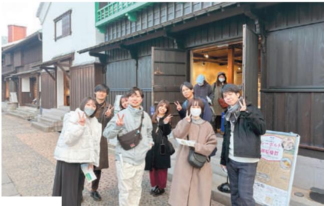
若手社員の笑顔が光る