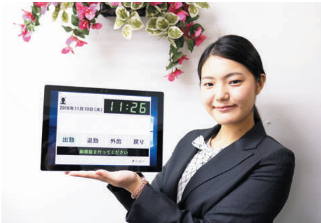
川崎ものづくりブランド認定された「打刻ちゃんTouch」