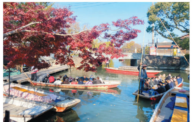
社員旅行で訪れた長崎

ボウリング大会、国内外の社員旅行、部活動（野球部・ゴルフ部・フットサル部）、ボランティア活動、川崎市中小企業大運動会などのほか、年に2度、社員全員が集まる「経営指針発表会・全社大会」を開催しています。社内の豊かなコミュニケーションがプロジェクト成功の原動力となっています。