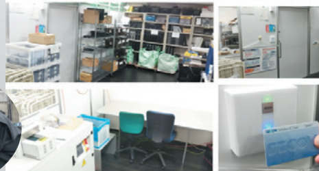
データの取り扱いには細心の注意を払っています