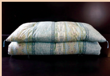
軽がる敷きふとん

※「令和5年度 米寿の川崎敬老祝い品」にも掲載されており大変好評をいただいております！