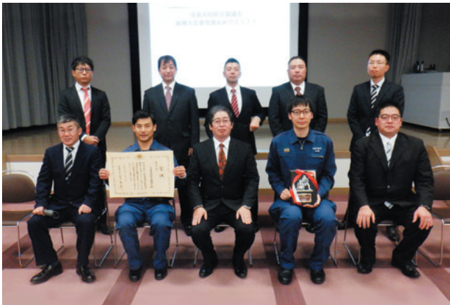
総理大臣賞受賞 表彰状と盾を手に