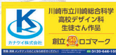
学生さんがデザインしたロゴマーク