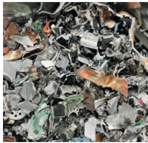
HDDもここまで細かく粉碎します