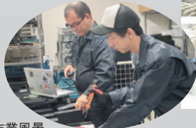
データ消去作業風景