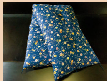
長々ひる寝ざぶとん