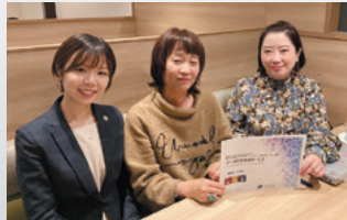
お気軽にご相談ください