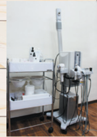
▲タカラベルモントのエステ機器「NOAGE (ノアージュ) SLFIP」を導入しました