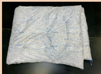
軽がる合掛ふとん