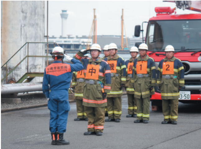
緊張感漂う技能コンテスト