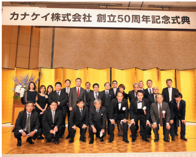
社員の笑顔が光る、50周年記念式典

をリニューアルしてもらいました。ラッピングバスも走らせて、地元の方への感謝の気持ちを表現しました。Bリーグの川崎ブレイブサンダースのスポンサー企業としても川崎を応援しています。日頃から共に頑張ってくれている社員には、神奈川の名産100選である箱根寄木細工のオリジナルコースターや、生活介護事業所 NPO 法人 studio FLATさんとの協働による、ロゴ入りエコバッグをプレゼントしました。社員からも、地域の皆さまからも、愛着をもっていただける警備会社として、何が出来るかを真摯に考え、一つでも多く実現していきたいと思いません。